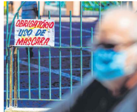
PARA GARANTIR segurança é preciso imunizar de 60% a 70% da população