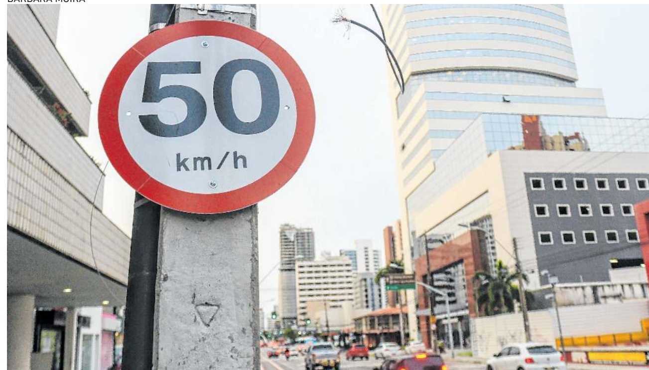
REDUÇÃO de 60 para 50 km/h aumenta a chance de uma pessoa atropelada sobreviver